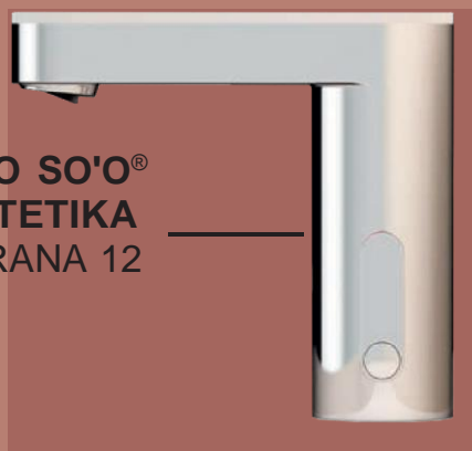
PRESTO SO'O® ESTETIKA STRANA 12