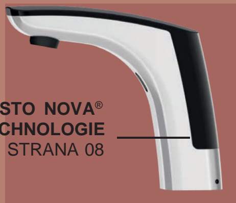
PRESTO NOVA® TECHNOLOGIE STRANA 08