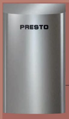
PRESTO C-DRY SYNERGIE STRANA 20