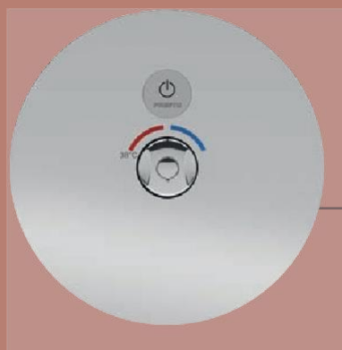
PRESTO BOX TOUCH® BEZPEČNOST STRANA 14