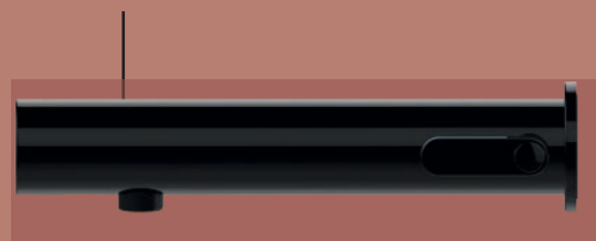
PRESTO LINEA® DESIGN STRANA 10